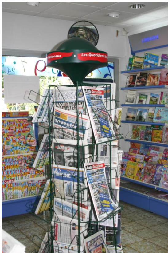
Tourniquet sur lequel sont placés les quotidiens.