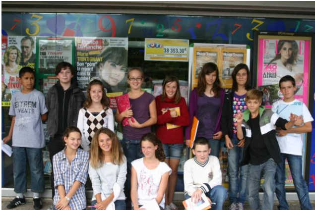
Première visite du kiosque à journaux, le lundi 13 septembre 2010