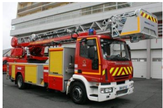
EPSH Echelle pivotante semi automatique (Déployée, l'échelle fait 32m de hauteur)

Attention, il faut être âgé d'au moins 12 ans pour passer ce test. Quant à la motivation, elle est très importante car il ne s'agit pas d'un engagement en l'air et les journées d'un JSP sont très très chargées !!