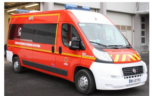
VSAV Véhicule de Secours et d'Assistances aux Victimes plus connu s'ou le nom d'ambulance.

Attention n'oubliez pas d'appeler les pompiers en cas d'urgence. Mais uniquement en cas d'urgence !!!