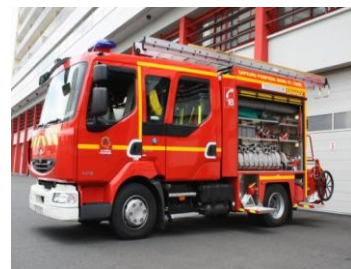
FPTL Forgeons Pompe Tonne Léger : camion fait pour éteindre les feus.

Les entraînements sont quelque fois rudes mais pour devenir pompier il faut avoir un bon niveau en sport mais aussi en théorie et pour cela il faut travailler en cours. Pendant les entraînements, nous pratiquons le sport et les manœuvres « incendie et secourisme » pour nous préparer aux différentes épreuves. Mais les manœuvres que nous pratiquons ne sont pas celles utilisées par les sapeurs pompiers. De plus, nous n'éteignons pas de vrais feux car cela est très dangereux. A chaque fois qu'un pompier part en intervention il n'est pas sûr de revenir vivant. Lors de nos manœuvres, nous utilisons tout de même le matériel des pompiers. Les moniteurs ont envie que l'on réussisse à devenir sapeur pompier mais pour cela ils nous donnent quelques fois des exercices difficiles à pratiquer. J'ai moi-même décidé il y a 3 ans de devenir JSP pour plus tard être Sapeur pompier. Mais je dois y consacrer beaucoup de temps durant la semaine : de 6 à 16h00 selon les semaines.